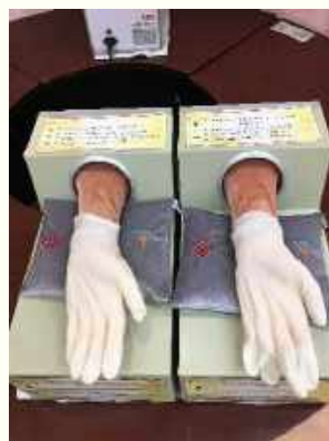
Yuen Yuen Institute Chinese Medicinal Nursing Lab 東洋医学看護実習室