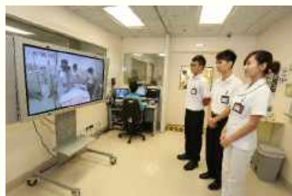
Laboratory / simulation sessions 実習室（シミュレーション）