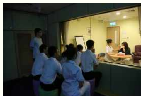
Mental Health Nursing Lab 精神看護学実習室