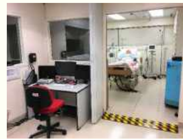
Dorothy Wong ICU Lab ICU 実習室