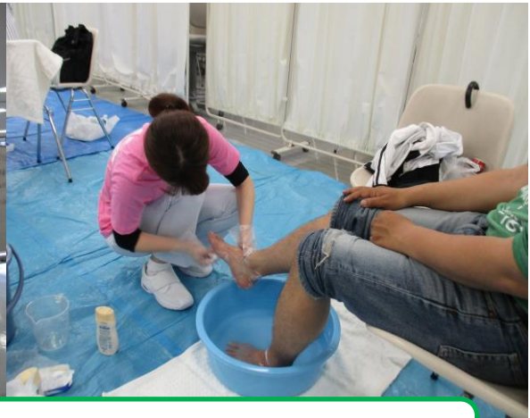
学生会による看護体験コーナー “足浴”