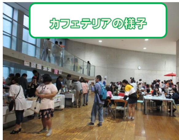
カフェテリアの様子